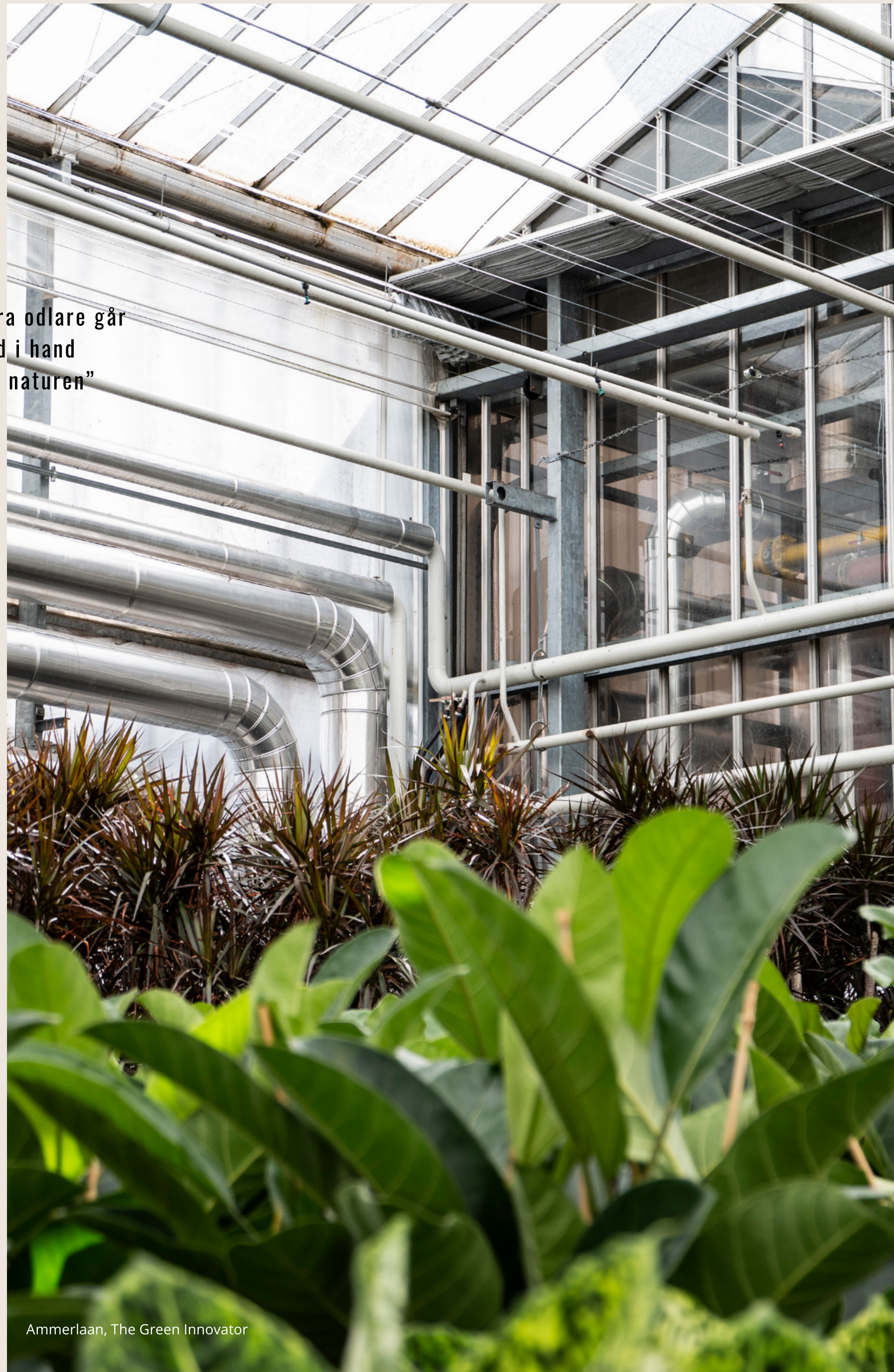
Ammerlaan, The Green Innovator