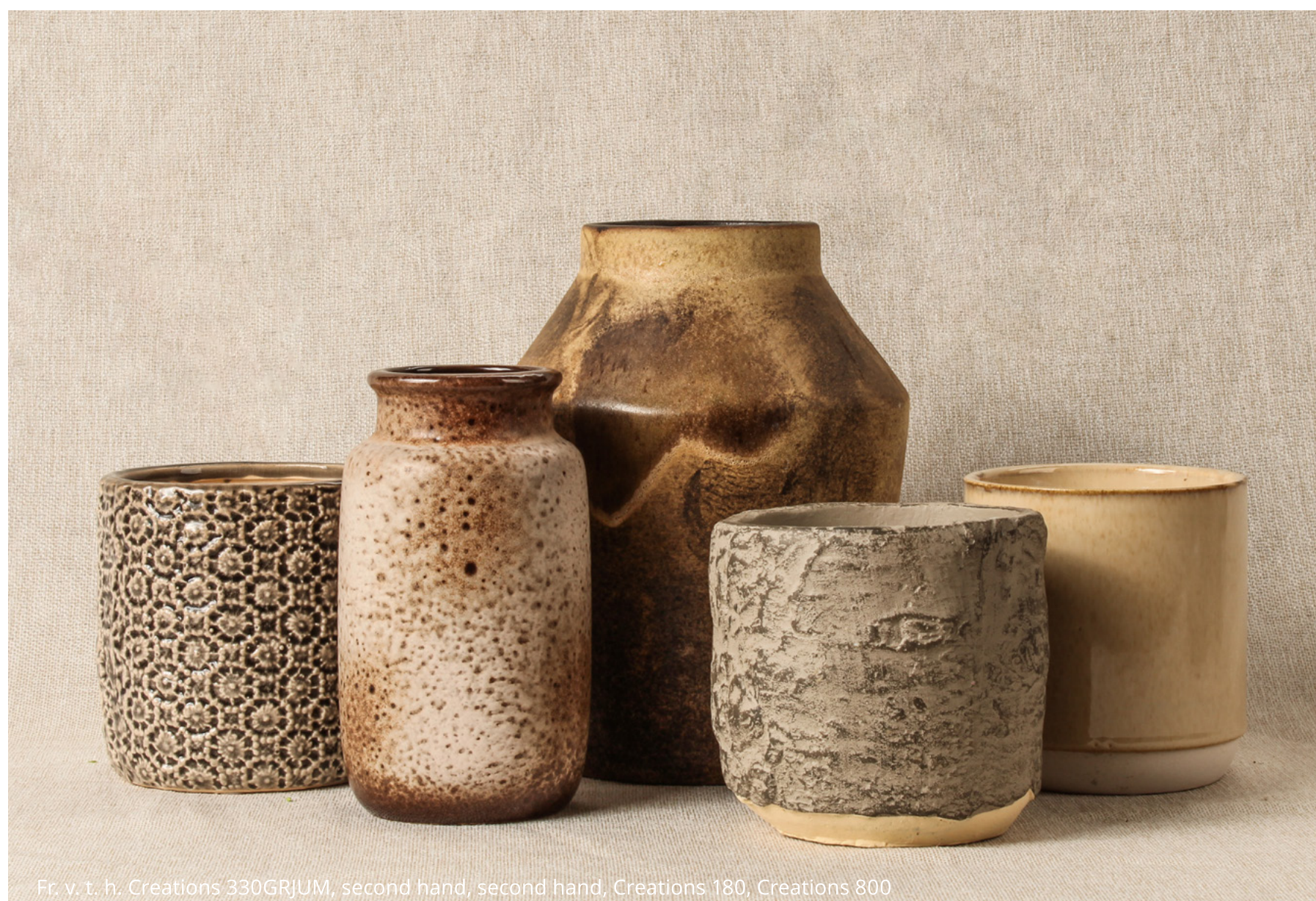
Fr. v. t. h. Creations 330GRJUM, second hand, second hand, Creations 180, Creations 800