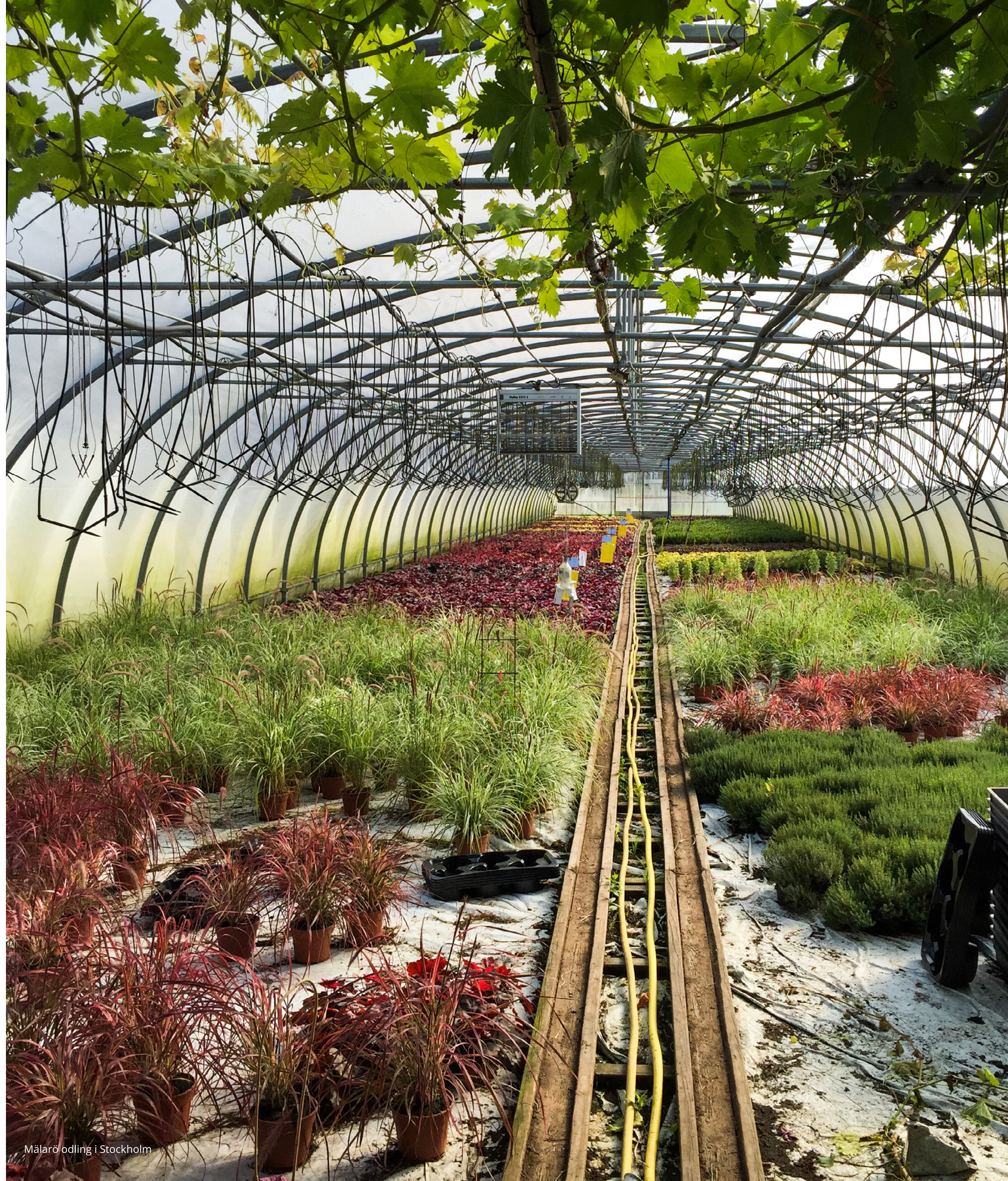
Mälardalens odling i Stockholm