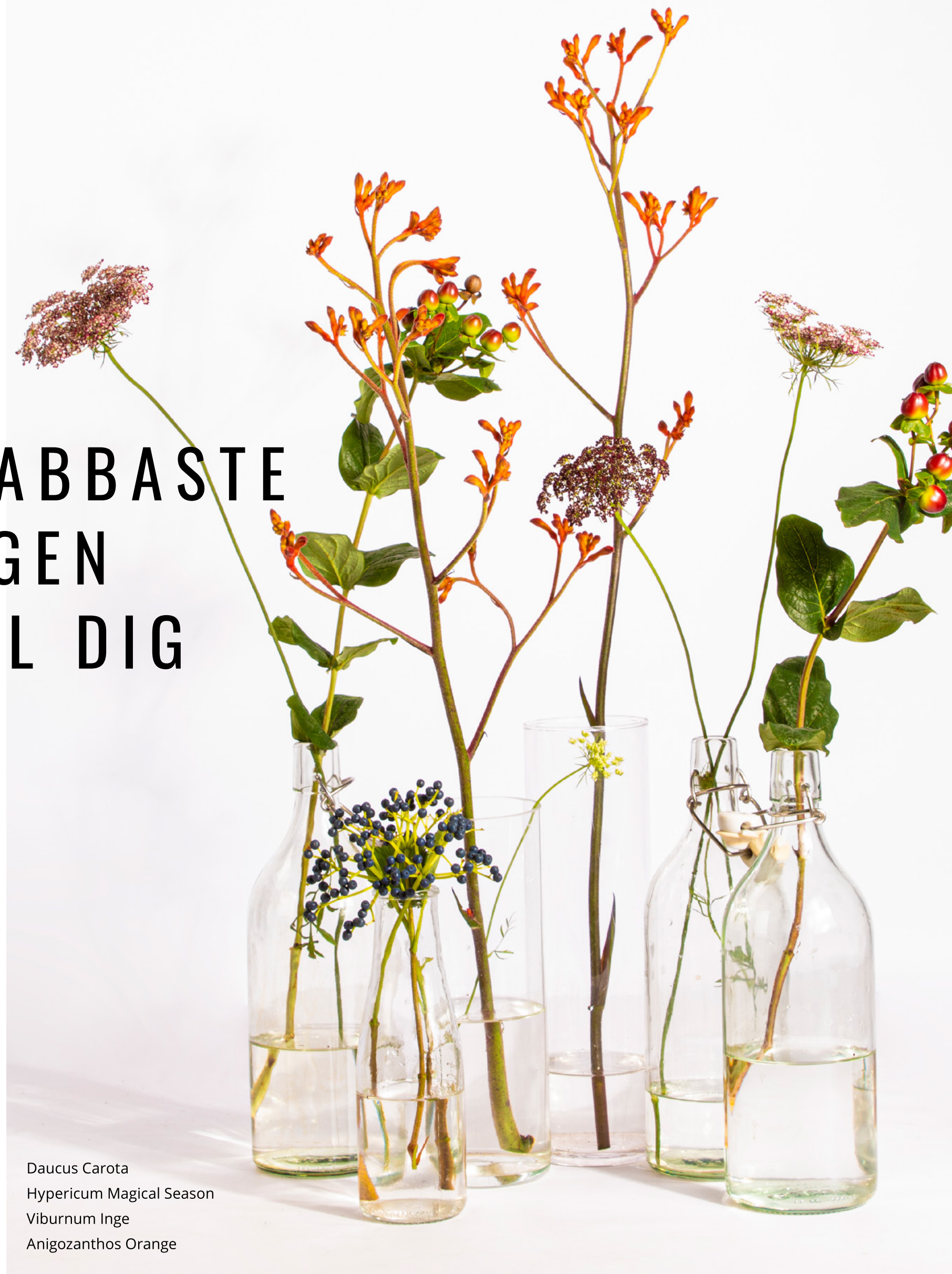
Daucus Carota Hypericum Magical Season Viburnum Inge Anigozanthos Orange

Vi har hittat den snabbaste vägen för blommorna att nå dig som kund. 90% av alla våra blommor köper vi direkt från odlarna. På morgonen gör vi beställningarna, sedan går leveranserna till dig från odlarna samma dag. Genom att skipa auktionerna, där blommorna har köpts in en eller flera dagar tidigare, ser vi till att du alltid får den fräschaste möjliga leveransen!