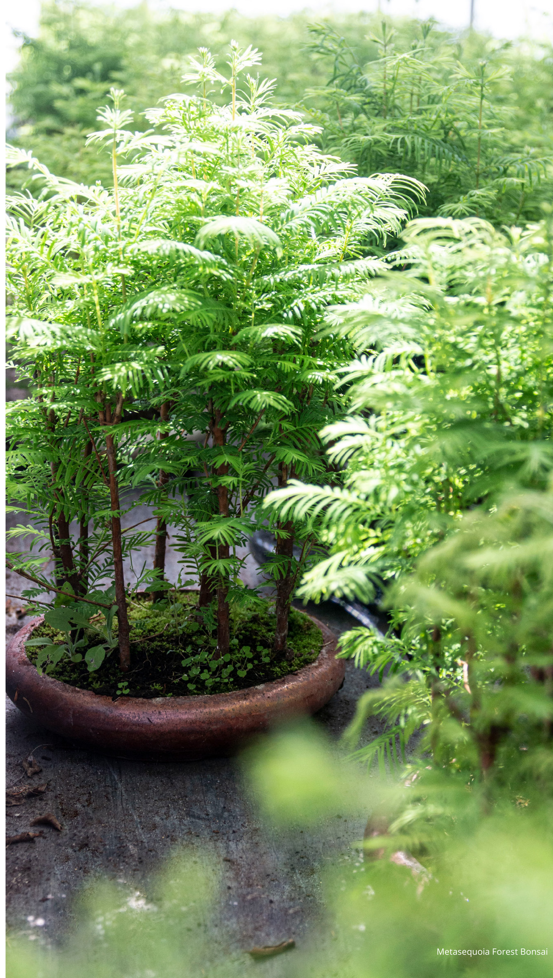
Metasequoia Forest Bonsai