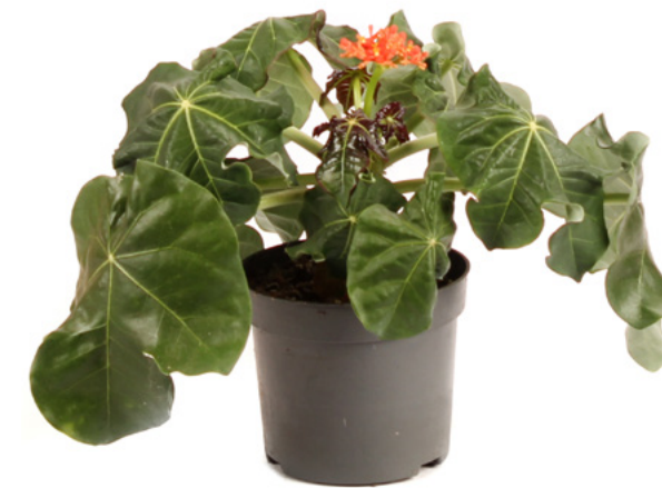
JATROPHA PODAGRICA Kruka 13 cm | Höjd 25 cm

Den här sällsynta växten har vackert skulpterade och böljande stammar. Den är en långsamt växande kaktus, men med tiden kan den växa sig riktigt stor och imponerande. Stammarna är mörkgröna, och kan anta spännande, fantasifulle formationer.