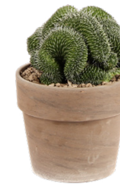
MARGINATOCEREUS CRISTATA Kruka 12 cm | Höjd 17,5 cm

Ur denna anmärkningsvärda, lökformade växt skjuter uppseendeväckande blad rakt upp som en solfjäder, eller som sidor i en bok, efter blomning. Den stora löken är hela tiden synbar ovan jord.