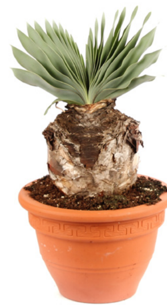
BOOPHANE DISTICHA Kruka 20 cm | Höjd 40 cm

Ur denna anmärkningsvärda, lökformade växt skjuter uppseendeväckande blad rakt upp som en solfjäder, eller som sidor i en bok, efter blomning. Den stora löken är hela tiden synbar ovan jord.