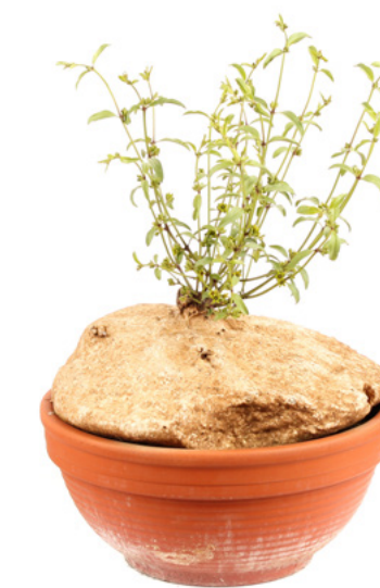
RAPHIONACME BURKEI Kruka 33 cm | Höjd 35 cm

Här är ett charmtroll som fångar allas uppmärksamhet. Podagrica betyder "svullen fot", och det är ganska så uppenbart hur växten har fått sitt namn! Den "svullna foten" fungerar som växtens vattenreservoar. Plantan har fikonlika blad och klarröda, korallliknande blommor hela året.