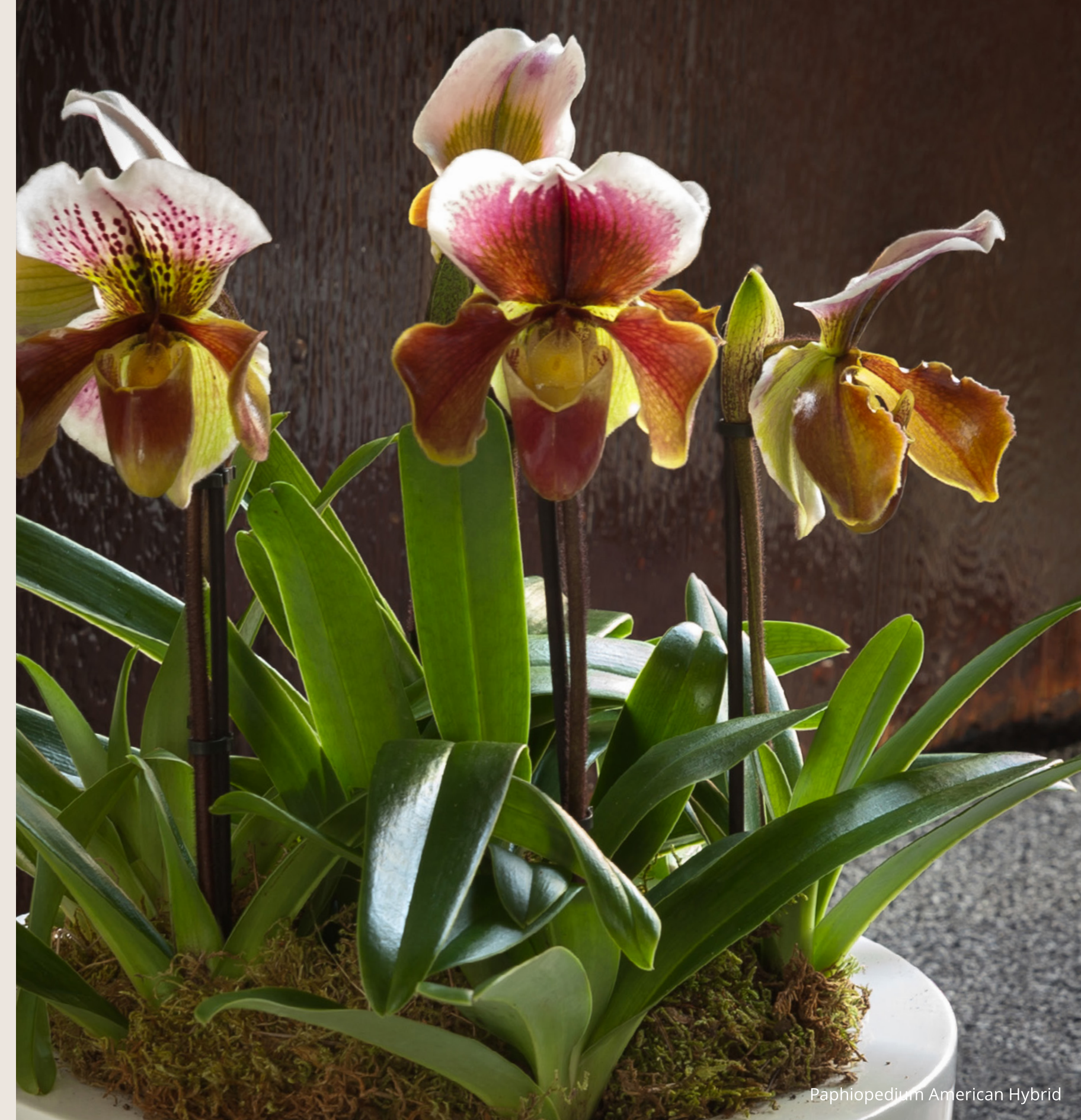
Paphiopedilum American Hybrid